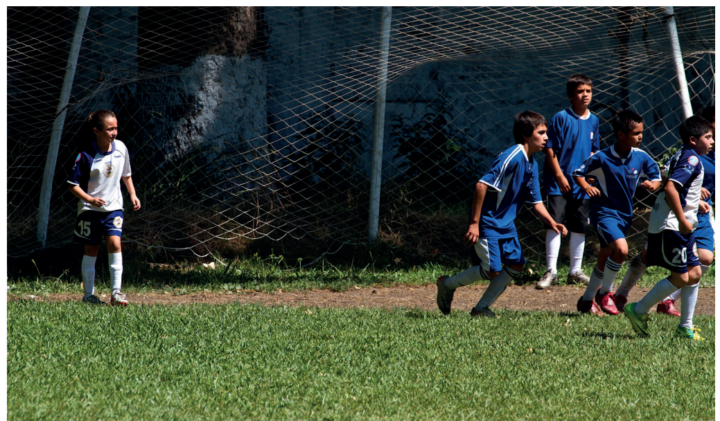
La Fortuna Fußball Projekt www.lafortuna.cl

Darüber hinaus wollen wir weiteren Produzenten mit persönlicher und finanzieller Unterstützung den Weg in faire Produktions- und Handelsstrukturen ermöglichen.